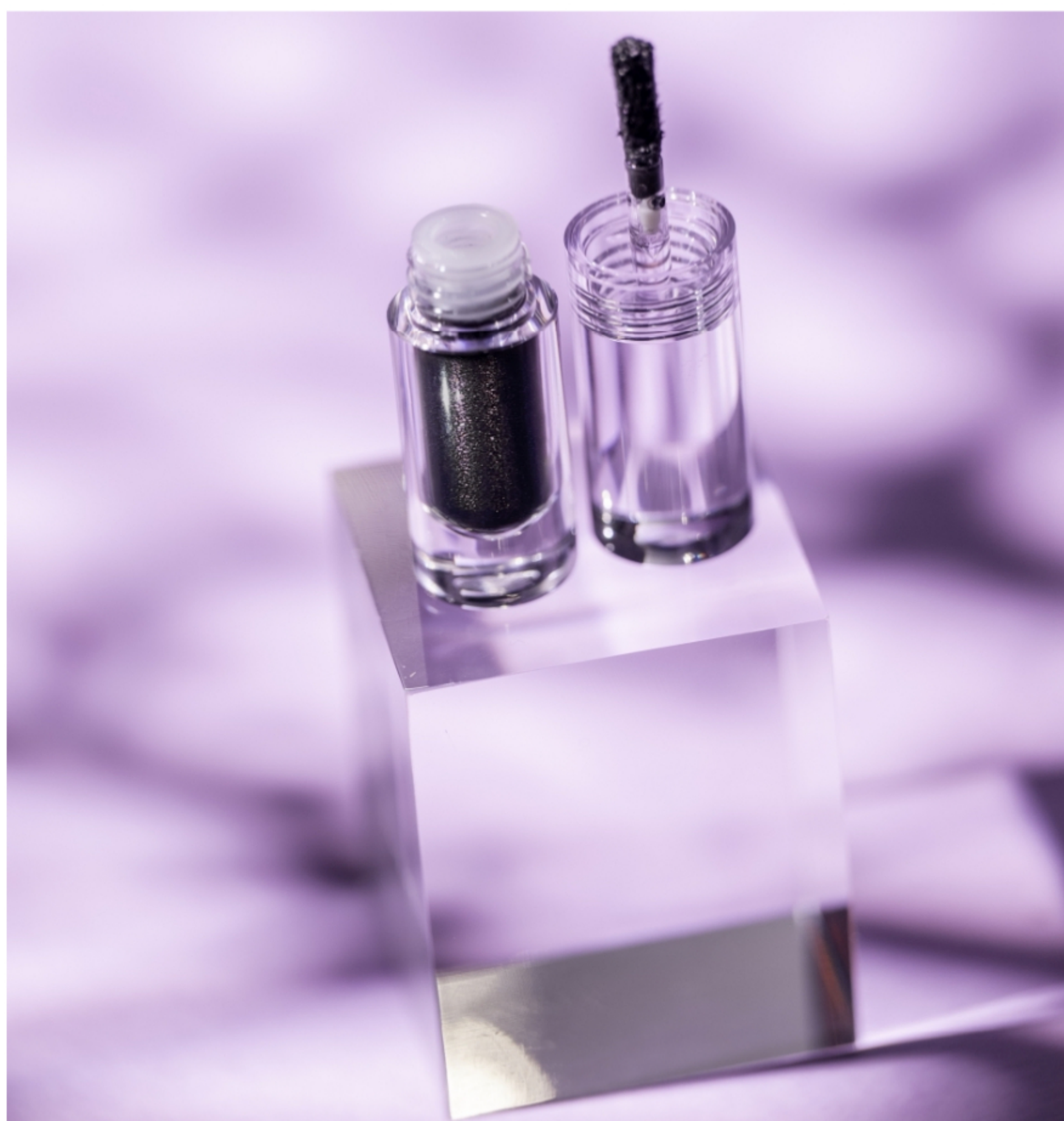
MIDNIGHT COSMIC EYESHADOW

Un altro prodotto Gotha è stato tra i finalisti della categoria Formulazione: Midnight Cosmic Eyeshadow, una texture unica e sorprendentemente trasformante che offre un effetto multicolore impareggiabile per un vero fattore wow.